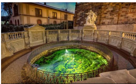
Donauquelle in Donaueschingen

Erstklassige Verpflegung inklusive - Wie immer offerieren wir Ihnen traditionell unseren Haus-Aperitif. Ab Konstanz servieren wir Ihnen das auf dem Zug zubereitete 4-Gänge Menu - vegetarisch oder mit Fleisch.