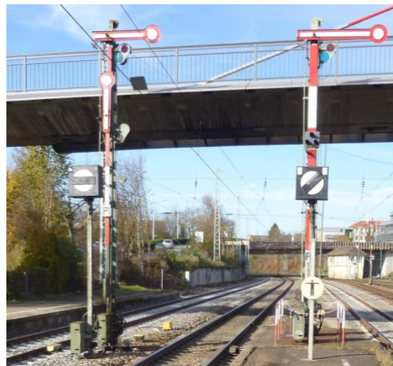
Alte Formsignale im Bahnhof Villingen

Start der Reise in Winterthur - Weiterer Zustieg in Frauenfeld, Weinfelden, Kreuzlingen und Konstanz. Rückkehr über Basel Bad Bf, Koblenz, Bülach zurück nach Winterthur.