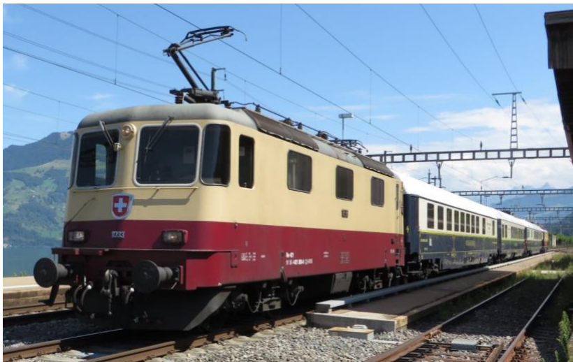
Speisewagenfahrt 2023, Immensee, Foto B. Ledermann

Erstmals laden wir Sie ein auf eine Fahrt in unser Nachbarland Deutschland ein, und zwar in den Schwarzwald. Mit den bewährten und stilvollen Wagen des Prestige Continental Express im Belle Époque-Stil und der in Deutschland zugelassenen Re 421 393 TEE als Zugmaschine reisen wir über die malerische Gebirgsbahn von Villingen via St. Georgen und Hausach nach Offenburg und über Basel dem Rhein entlang zurück nach Winterthur. Geniessen Sie dabei ein typisches Schwarzwälder Menu mit einer dazu passenden Weinauswahl.